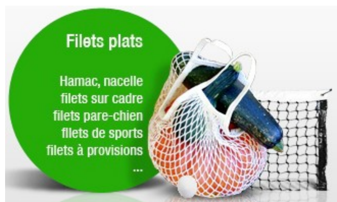
Exemples de produits réalisés