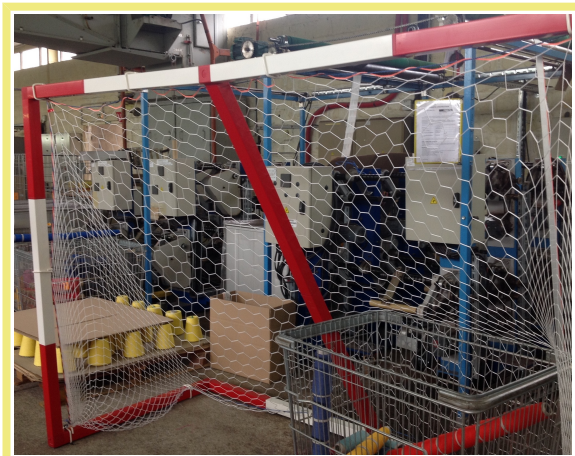
Cage avec filet constitué de mailles différentes

Cette société utilise des machines automatiques pour réaliser certains produits. Ces machines peuvent réaliser différentes tailles de maille ce qu'une machine traditionnelle ne peut pas effectuer. Elles sont utilisées pour la production de filets comme ceux des cages de hand-ball qui sont constituées de plusieurs tailles et formes de maille.