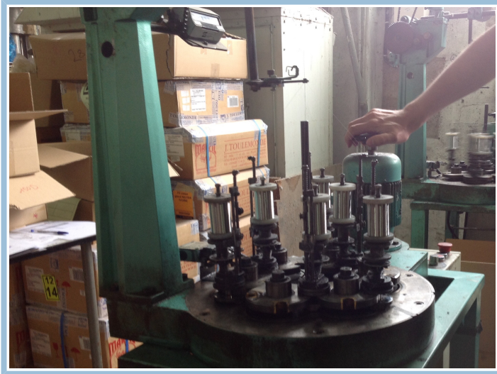
Machine de tissage traditionnelle

La machine traditionnelle de tissage peut être utilisée pour fabriquer différentes formes de maille qui ne peuvent pas être modulables. Elle permet de fabriquer notamment des bas de ligne de pêche et des cordons qui allient les différentes propriétés des matériaux. Cette démarche permet de varier les produits réalisés par l'entreprise.