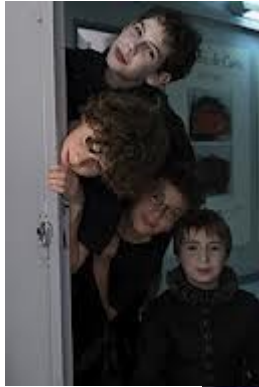
Vénus et Adonis:

Nous vous souhaitons nos meilleures vœux et une très bonne année 2013 à vous tous.