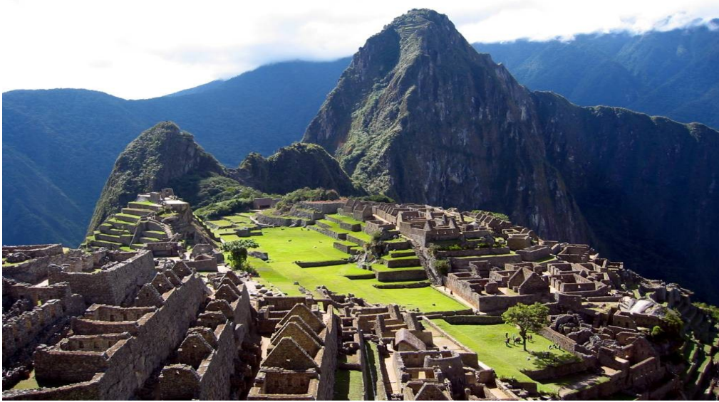
le Macchu Picchu

Les Incas avaient une architecture TRÈS AVANCÉE : ils prenaient des pierres en forme de polygone qu'ils assemblaient , avec une très grande précision. Ils les amenaient en altitude pour construire des temples tel que le Macchu Picchu , ancienne cité incas du 15 ème siècle. La disposition réfléchie des pierres évitait que la cité ressente les secousses de la Terre lors d'un tremblement. Ainsi, l'altitude ne les effrayait pas, d'autant plus qu'ils vivaient plus près de leur Dieu. Également, les Amérindiens vivaient grâce à l'agriculture, par conséquent, tout était pensé pour une meilleure irrigation. L'architecture favorisait l'écoulement de l'eau.